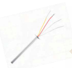
Bộ gia nhiệt thép HS-3050