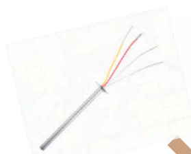
Bộ gia nhiệt thép HS-3050