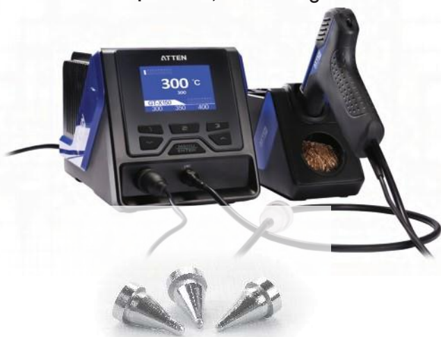
Đầu súng hút thiếc hàn

Trạm hàn, hút thông minh kênh đơn cao cấp không chì